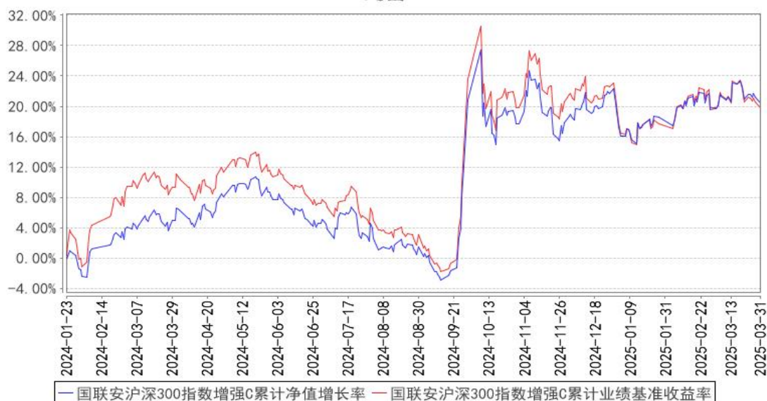
国联安沪深300指数增强C累计净值增长率与同期业绩比较基准收益率的历史走势对比图