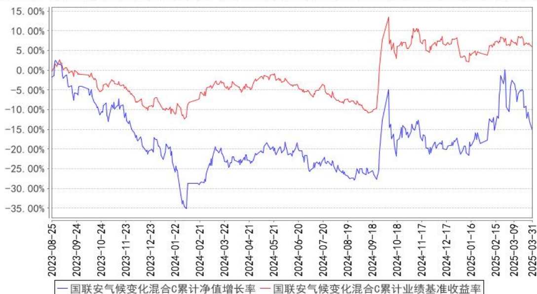
国联安气候变化混合C累计净值增长率与同期业绩比较基准收益率的历史走势对比图

注：1、国联安气候变化责任投资混合型证券投资基金于 2023 年 8 月 17 日起增加收取销售服务费的 C 类基金份额，并对本基金基金合同及托管协议作相应修改，原有的基金份额在开放申购赎回