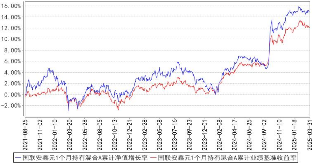
国联安鑫元1个月持有混合A累计净值增长率与同期业绩比较基准收益率的历史走势对比图

注：1、本基金业绩比较基准为中证全债指数收益率*80%+沪深 300 指数收益率*15%+恒生指数收益率*5%； 2、本基金基金合同于 2021 年 8 月 25 日生效； 3、本基金建仓期为自基金合同生效之日起的 6 个月，建仓期结束时各项资产配置符合合同约定。