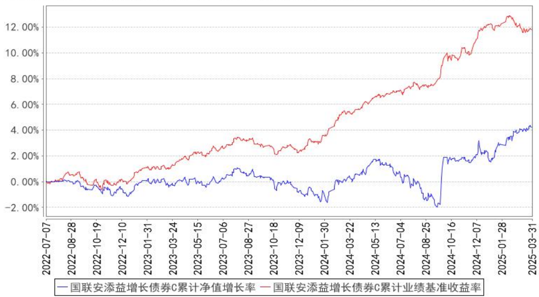
国联安添益增长债券C累计净值增长率与同期业绩比较基准收益率的历史走势对比图

注：1、本基金业绩比较基准为中债新综合财富指数收益率*90%+沪深 300 指数收益率*8%+中证港股通综合指数(人民币)收益率*2%； 2、本基金基金合同于 2022 年 7 月 7 日生效； 3、本基金建仓期为自基金合同生效之日起的 6 个月，建仓期结束时各项资产配置符合合同约定。