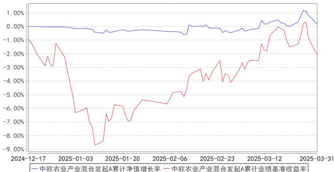
中欧农业产业混合发起A累计净值增长率与同期业绩比较基准收益率的历史走势对比图

注：本基金基金合同生效日期为 2024 年 12 月 17 日，自基金合同生效日起到本报告期末不满一年，按基金合同的规定，本基金自基金合同生效起六个月为建仓期，建仓期结束时各项资产配置比例应当符合基金合同约定。