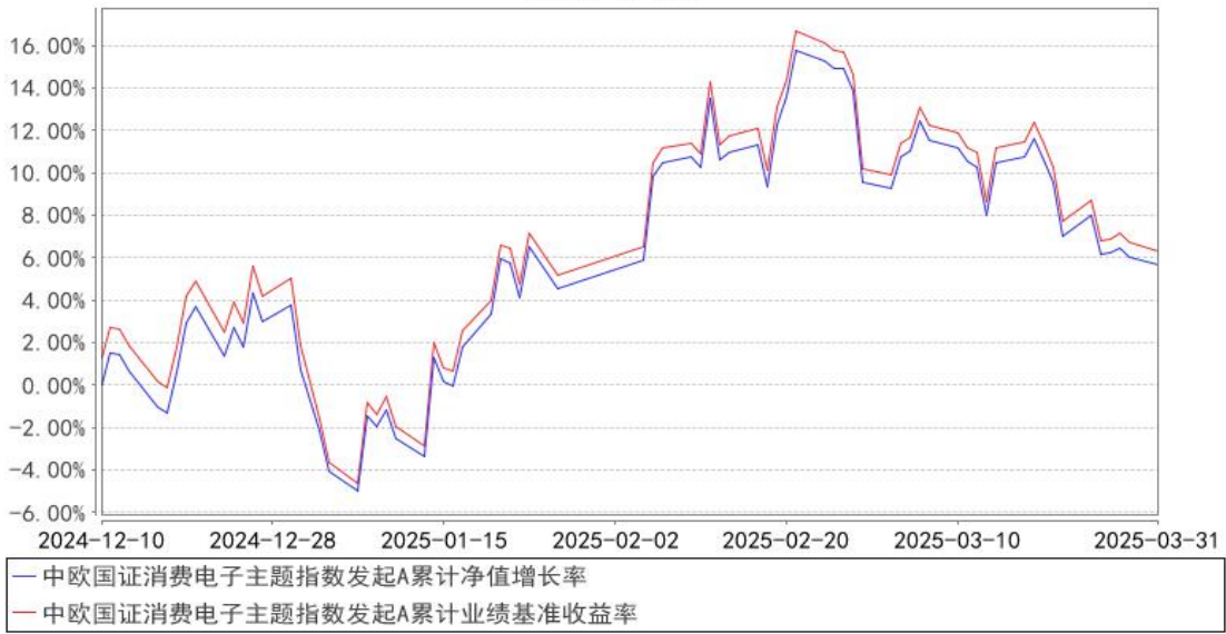
中欧国证消费电子主题指数发起A累计净值增长率与同期业绩比较基准收益率的历史 走势对比图

注：本基金基金合同生效日期为 2024 年 12 月 10 日，自基金合同生效日起到本报告期末不满一年，按基金合同的规定，本基金自基金合同生效起六个月为建仓期，建仓期结束时各项资产配置比例应当符合基金合同约定。