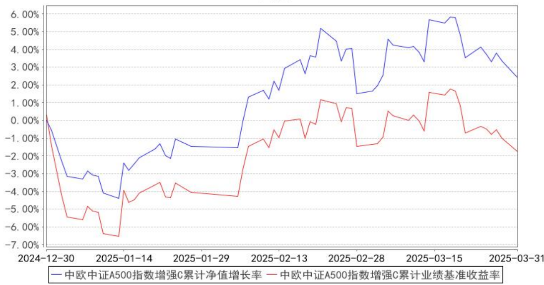
中欧中证A500指数增强C累计净值增长率与同期业绩比较基准收益率的历史走势对比图

注：本基金基金合同生效日期为 2024 年 12 月 30 日，自基金合同生效日起到本报告期末不满一年，按基金合同的规定，本基金自基金合同生效起六个月为建仓期，建仓期结束时各项资产配置比例应当符合基金合同约定。