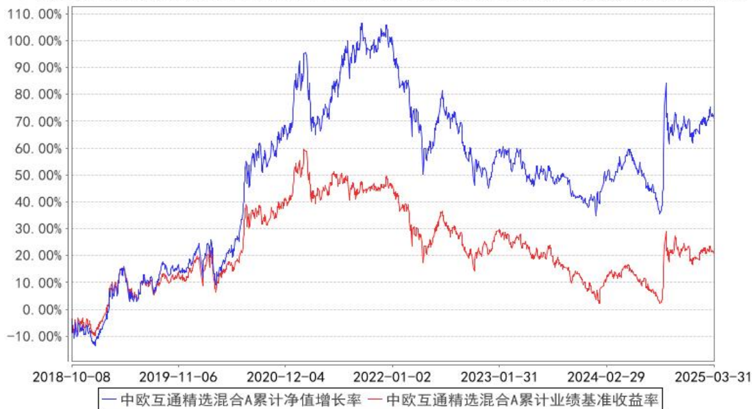
中欧互通精选混合A累计净值增长率与同期业绩比较基准收益率的历史走势对比图

注：自 2018 年 10 月 8 日起，原中欧沪深 300 指数增强型证券投资基金转型为中欧互通精选混合型证券投资基金。图示为 2018 年 10 月 8 日至 2025 年 03 月 31 日。