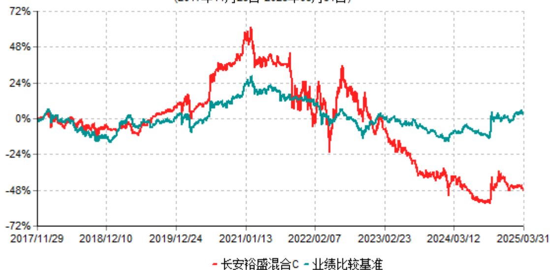
长安裕盛混合C累计净值增长率与业绩比较基准收益率历史走势对比图 (2017年11月29日-2025年03月31日)

根据基金合同的规定,自基金合同生效之日起 6 个月内基金各项资产配置比例需符合基金合同要求。本基金在建仓期结束后,各项资产配置比例已符合基金合同有关投资比例的约定。基金合同生效日至报告期期末,本基金运作时间超过一年。图示日期为 2017 年 11 月 29 日至 2025 年 3 月 31 日。