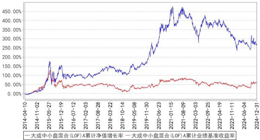
大成中小盘混合(LOF)A累计净值增长率与同期业绩比较基准收益率的历史走势对比图

(二) 自基金合同生效以来基金份额累计净值增长率变动及其与同期业绩比较基准收益率变动的比较