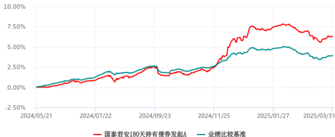
国泰君安180天持有债券发起A累计净值增长率与业绩比较基准收益率历史走势对比图 (2024年05月21日-2025年03月31日)

注：1、本基金于 2024 年 5 月 21 日成立，自合同生效日起至本报告期末不足一年。