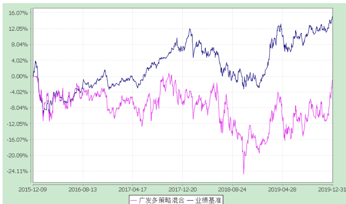
广发多策略灵活配置混合型证券投资基金 份额累计净值增长率与业绩比较基准收益率的历史走势对比图 (2015 年 12 月 9 日至 2019 年 12 月 31 日)