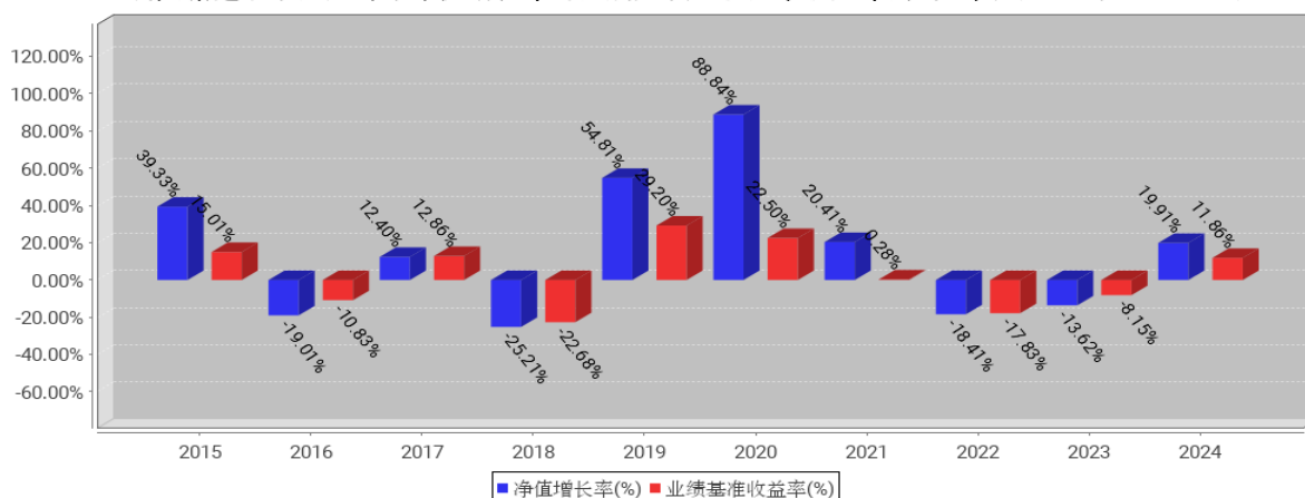
工银研究精选股票基金每年净值增长率与同期业绩比较基准收益率的对比图（2024年12月31日）

注：1、本基金基金合同于 2014 年 10 月 23 日生效。合同生效当年不满完整自然年度的，按实际期限计算净值增长率。