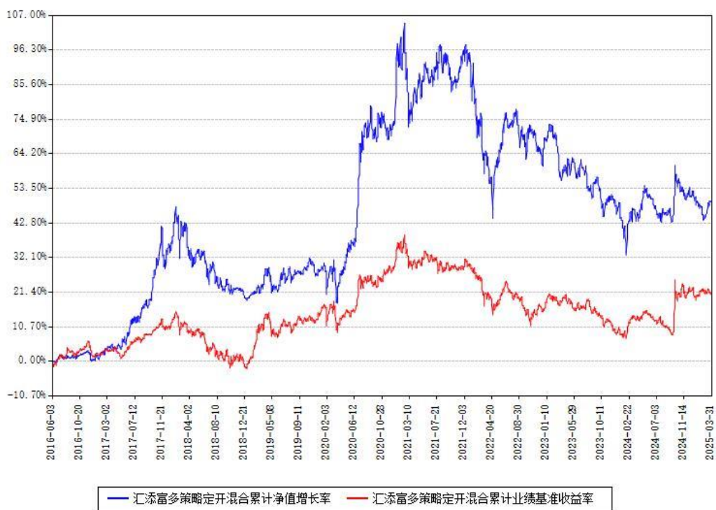
汇添富多策略定开混合累计净值增长率与同期业绩基准收益率对比图