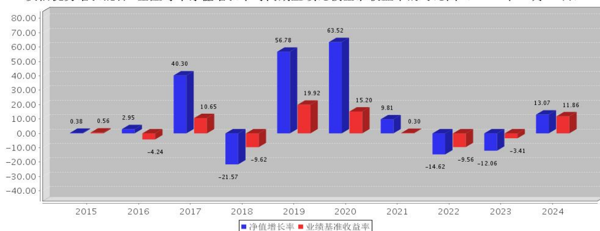
安信优势增长混合C基金每年净值增长率与同期业绩比较基准收益率的对比图（2024年12月31日）

注：根据基金管理人2015年11月17日《关于安信优势增长灵活配置混合型证券投资基金增加C类份额并修改基金合同的公告》，自2015年11月17日起，本基金增加C类份额。基金合同生效当年期间的相关数据按实际存续期计算。基金的过往业绩并不代表其未来表现。