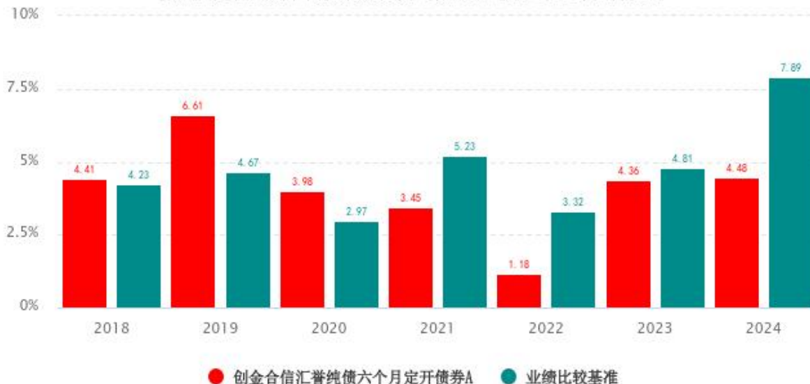
基金的过往业绩不代表未来表现，数据截止日：2024年12月31日