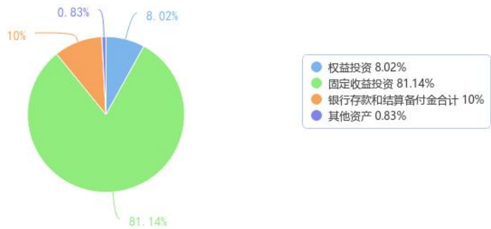
投资组合资产配置图表（数据截至日期：2025年03月31日）