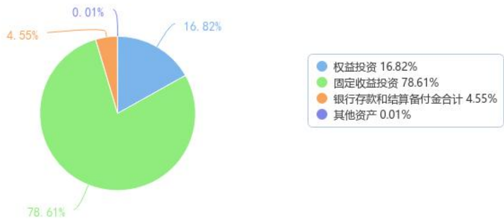
投资组合资产配置图表（数据截至日期：2025年03月31日）