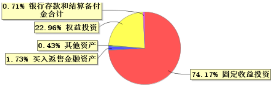
投资组合资产配置图表(2025年3月31日)

● 固定收益投资 ● 买入返售金融资产 ● 其他资产 ● 权益投资 ● 银行存款和结算备付金合计