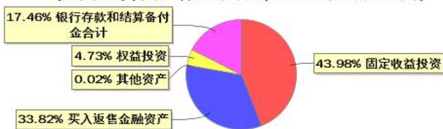
投资组合资产配置图表(2025年3月31日)

● 固定收益投资 ● 买入返售金融资产 ● 其他资产 ● 权益投资 ● 银行存款和结算备付金合计