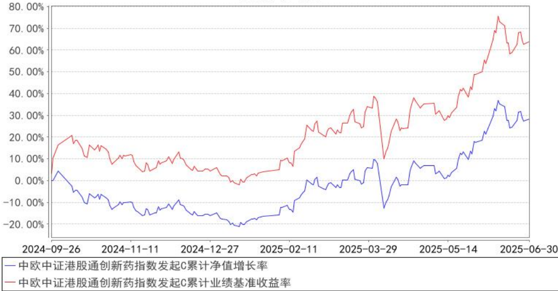
中欧中证港股通创新药指数发起C累计净值增长率与同期业绩比较基准收益率的历史 走势对比图

注：本基金基金合同生效日期为 2024 年 9 月 26 日，自基金合同生效日起到本报告期末不满一年，按基金合同的规定，本基金自基金合同生效起六个月为建仓期，建仓期结束时各项资产配置比例已经符合基金合同约定。