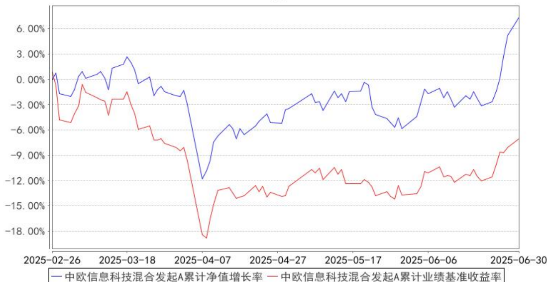
中欧信息科技混合发起A累计净值增长率与同期业绩比较基准收益率的历史走势对比图

注：本基金基金合同生效日期为 2025 年 2 月 26 日，自基金合同生效日起到本报告期末不满一年，按基金合同的规定，本基金自基金合同生效起六个月为建仓期，建仓期结束时各项资产配置比例应当符合基金合同约定。