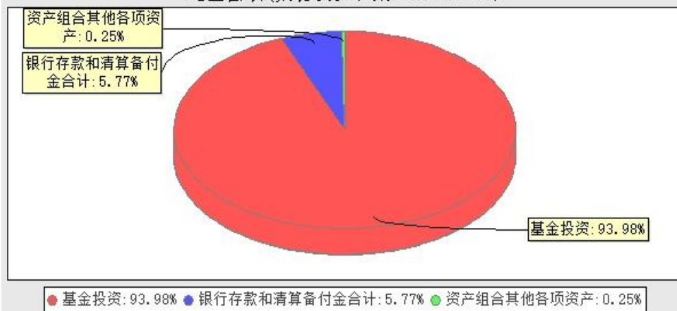
华宝中证科技龙头交易型开放式指数证券投资基金发起式联接基金投资组合资产配置图表(数据截止日期: 20250331)