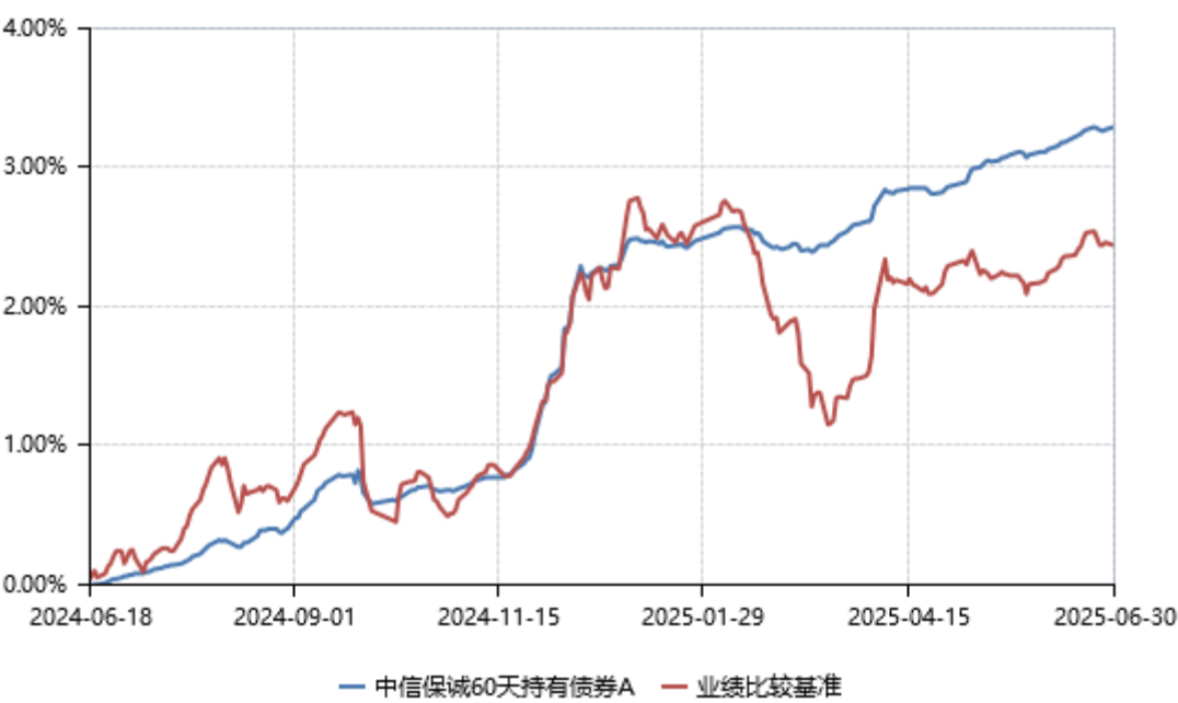
中信保诚 60 天持有债券 A