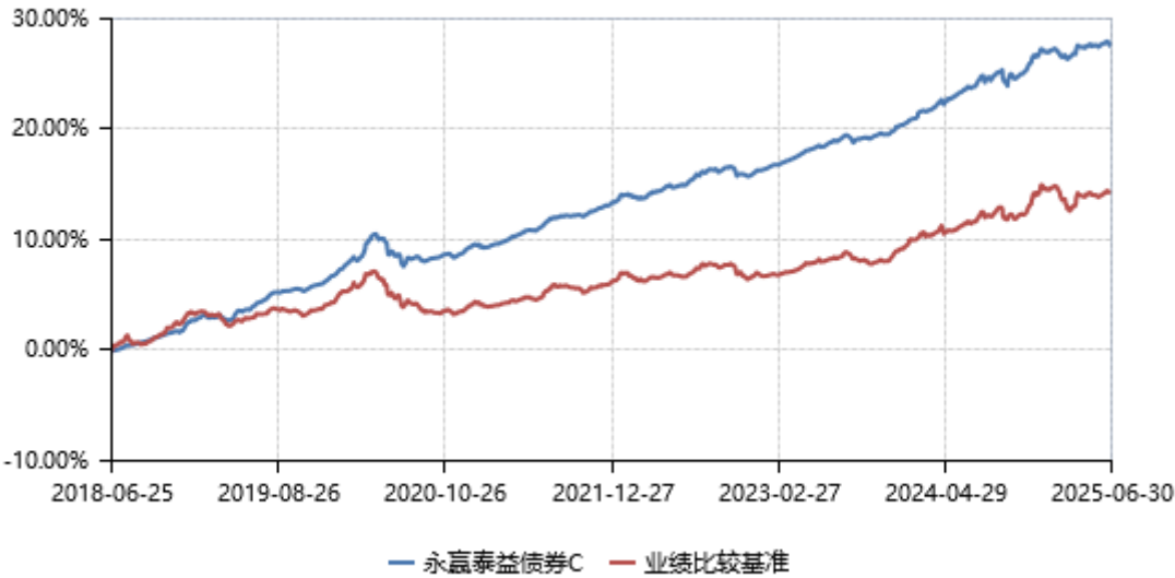
永赢泰益债券C累计净值收益率与业绩比较基准收益率历史走势对比图 (2018年06月25日-2025年06月30日)