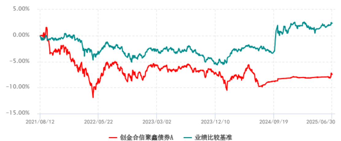
创金合信聚鑫债券A累计净值增长率与业绩比较基准收益率历史走势对比图 (2021年08月12日-2025年06月30日)