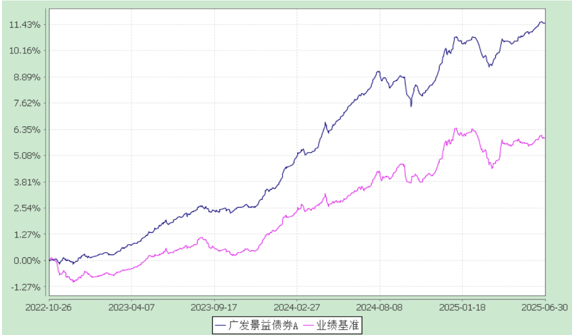
广发景益债券型证券投资基金 累计净值增长率与业绩比较基准收益率的历史走势对比图 (2022 年 10 月 26 日至 2025 年 6 月 30 日)