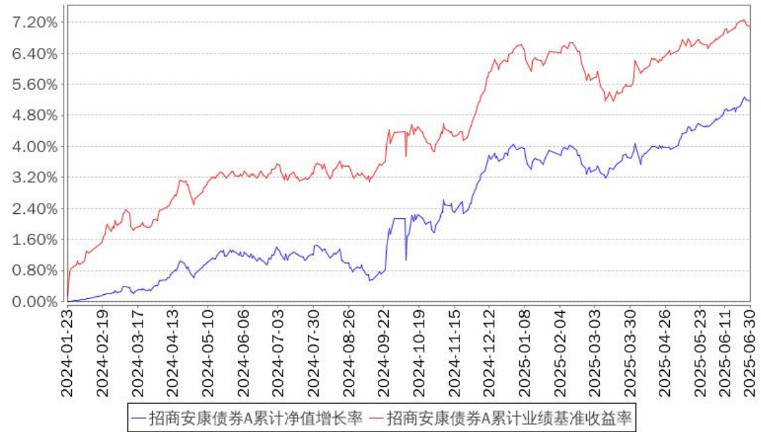
招商安康债券A累计净值增长率与同期业绩比较基准收益率的历史走势对比图