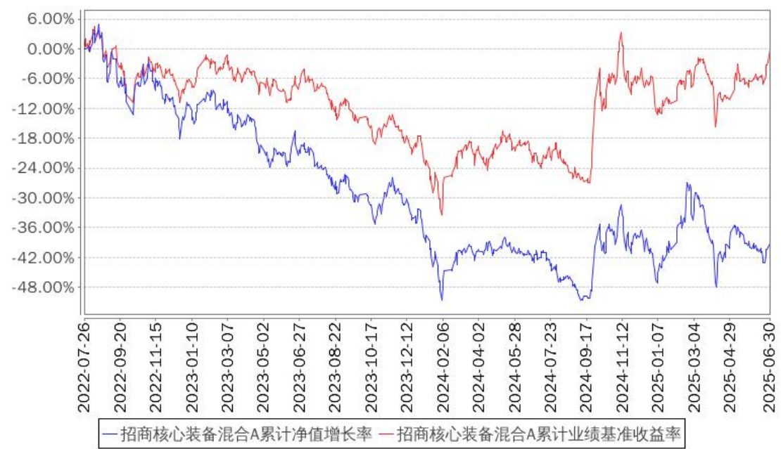
招商核心装备混合A累计净值增长率与同期业绩比较基准收益率的历史走势对比图