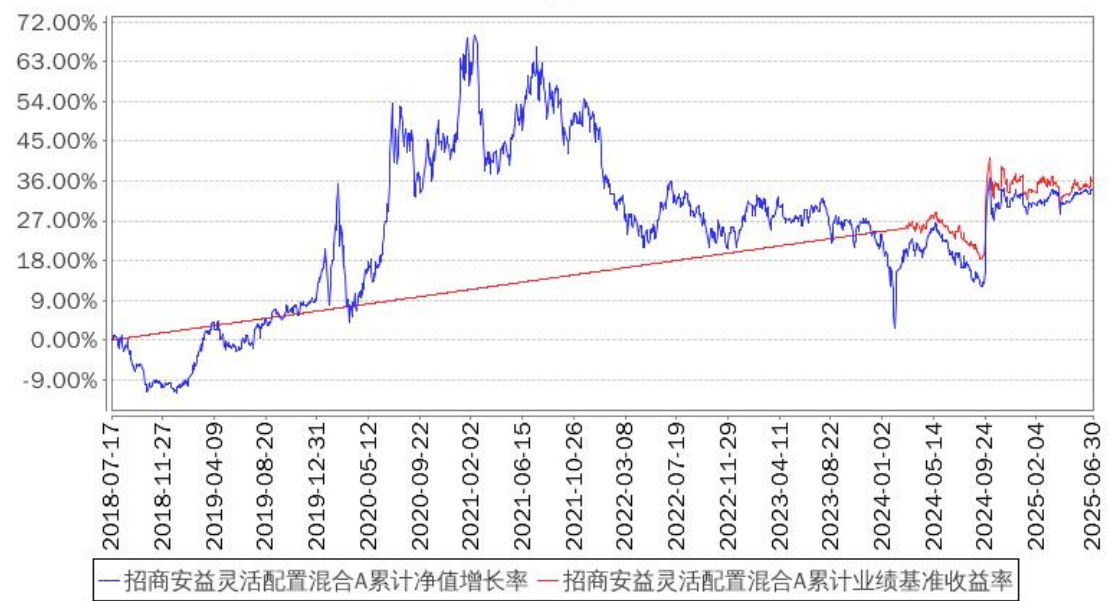
招商安益灵活配置混合A累计净值增长率与同期业绩比较基准收益率的历史走势对比图