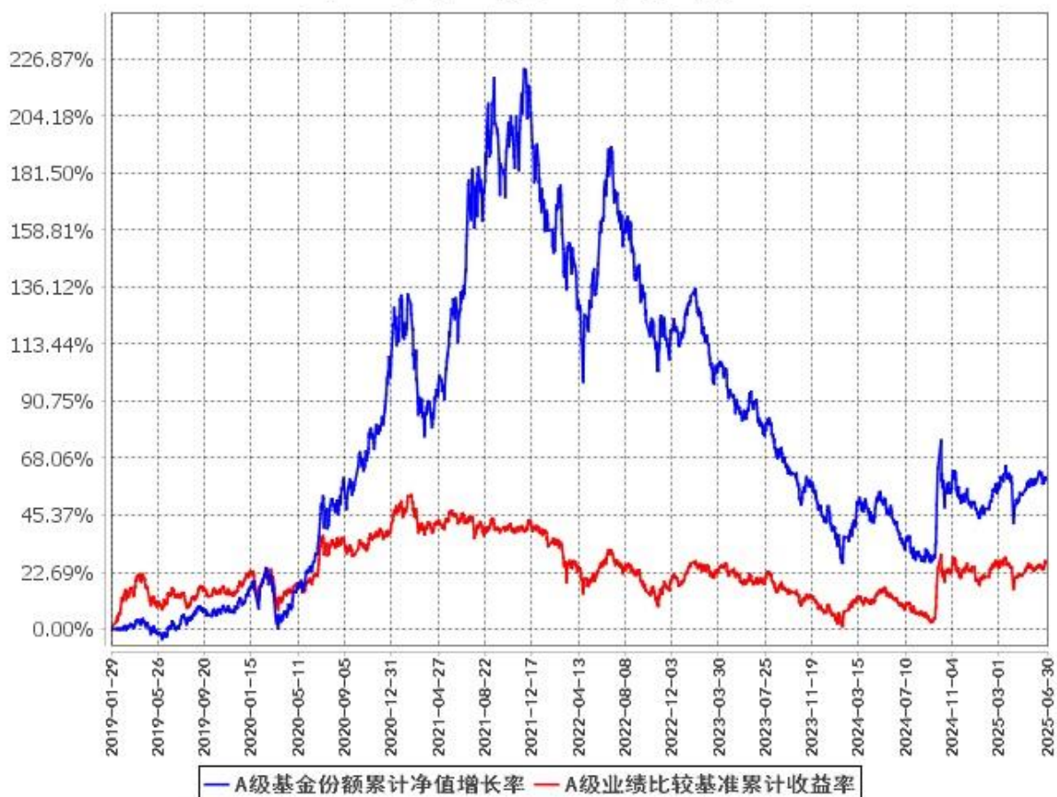
A级基金份额累计净值增长率与同期业绩比较基准收益率的历史走势对比图 (2019年1月29日至2025年6月30日)