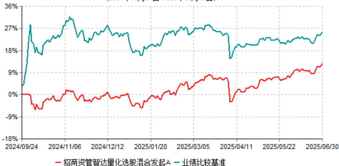
招商资管智达量化选股混合发起A累计净值增长率与业绩比较基准收益率历史走势对比图 (2024年09月24日-2025年06月30日)

注：（1）本基金合同于2024年09月24日生效，截至本报告期末不满一年；（2）按基金合同和招募说明书的约定，本基金建仓期为合同生效后6个月，建仓期结束时各项资产配置比例符合合同有关规定。