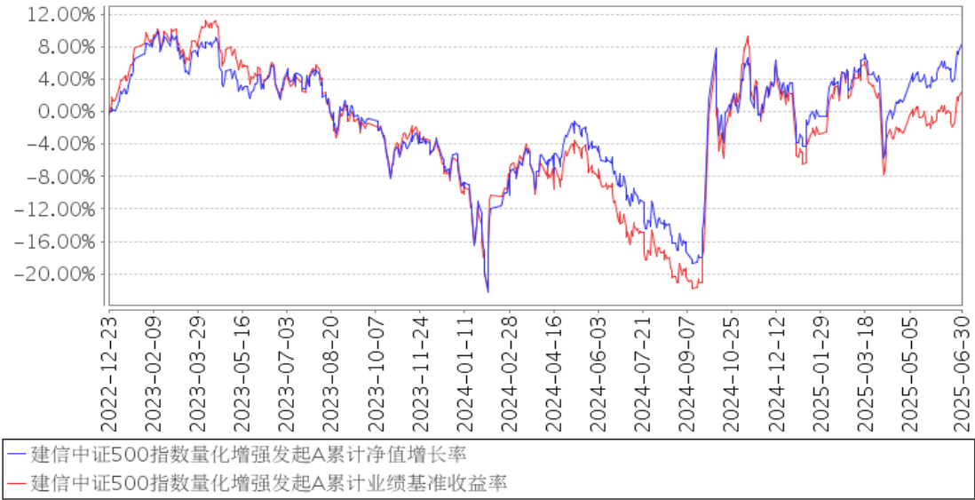
建信中证500指数量化增强发起A累计净值增长率与同期业绩比较基准收益率的历史走势对比图