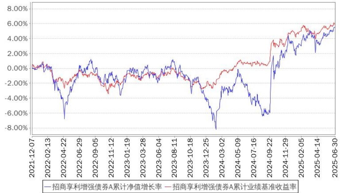
招商亨利增强债券A累计净值增长率与同期业绩比较基准收益率的历史走势对比图