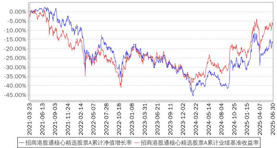
招商港股通核心精选股票A累计净值增长率与同期业绩比较基准收益率的历史走势对比图