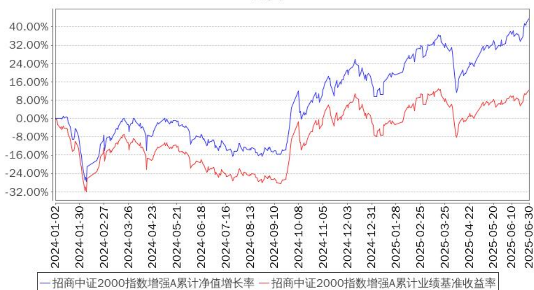
招商中证2000指数增强A累计净值增长率与同期业绩比较基准收益率的历史走势对比图