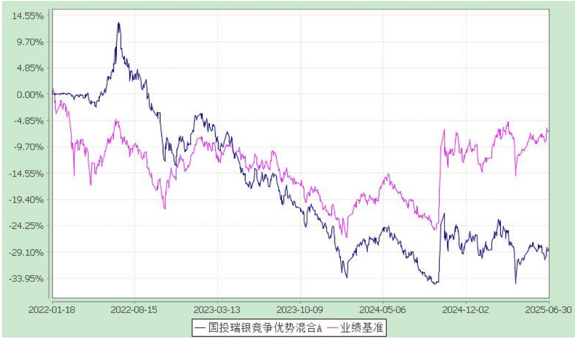
国投瑞银竞争优势混合型证券投资基金 累计净值增长率与业绩比较基准收益率的历史走势对比图 (2022 年 1 月 18 日至 2025 年 6 月 30 日)