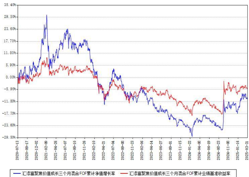
汇添富聚焦价值成长三个月混合FOF累计净值增长率与同期业绩基准收益率对比图