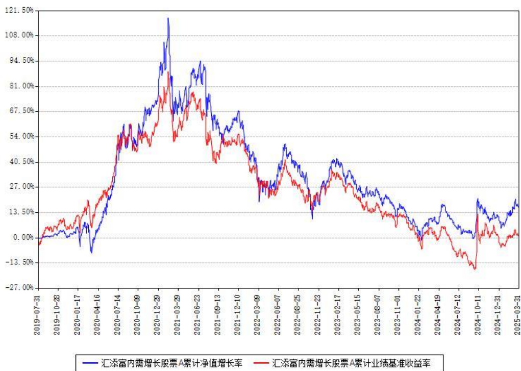
汇添富内需增长股票A累计净值增长率与同期业绩基准收益率对比图