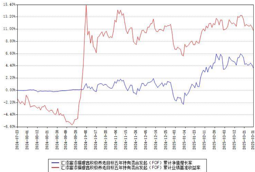
汇添富添福睿鑫积极养老目标五年持有混合发起（FOF）累计净值增长率与同期业绩基准收益率对比图