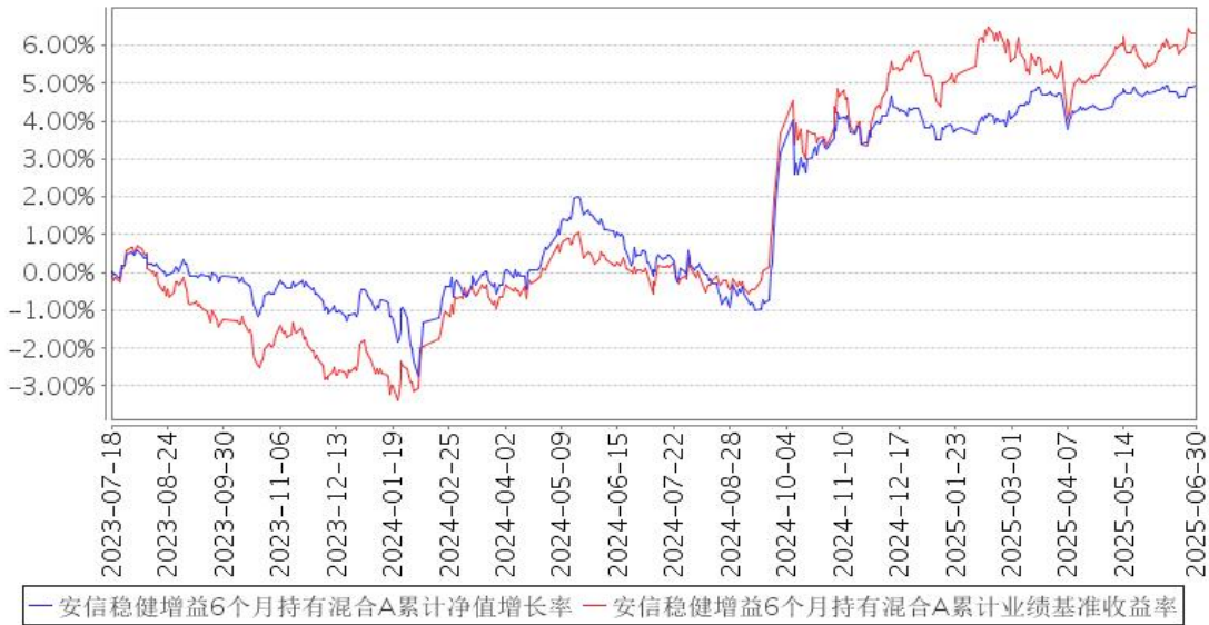
安信稳健增益6个月持有混合A累计净值增长率与同期业绩比较基准收益率的历史走势对比图