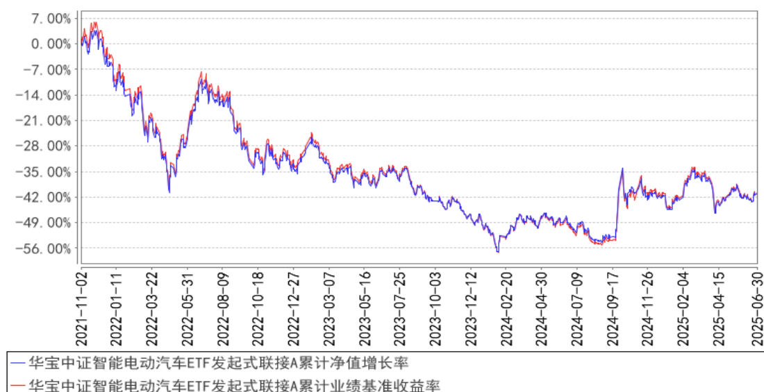
华宝中证智能电动汽车ETF发起式联接A累计净值增长率与同期业绩比较基准收益率的历史走势对比图