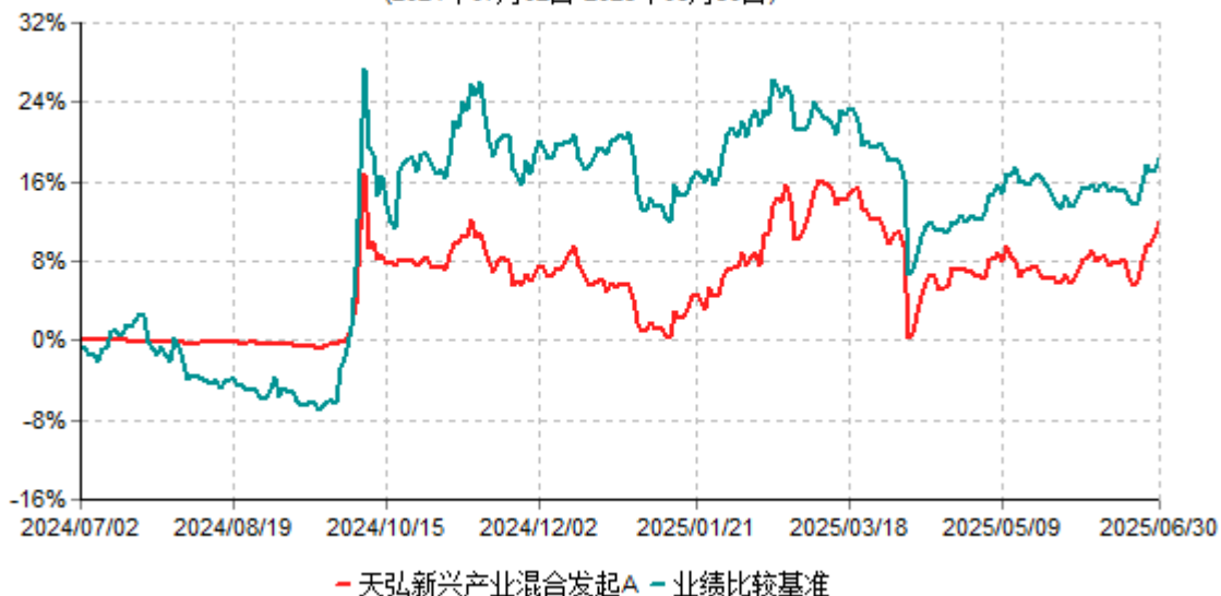
天弘新兴产业混合发起A累计净值增长率与业绩比较基准收益率历史走势对比图 (2024年07月02日-2025年06月30日)