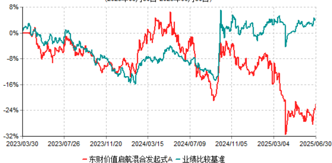
东财价值启航混合发起式A累计净值增长率与业绩比较基准收益率历史走势对比图 (2023年03月30日-2025年06月30日)