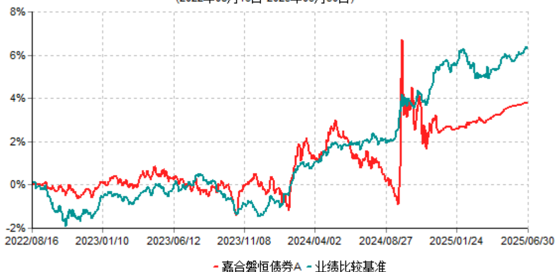
嘉合磐恒债券A累计净值增长率与业绩比较基准收益率历史走势对比图 (2022年08月16日-2025年06月30日)