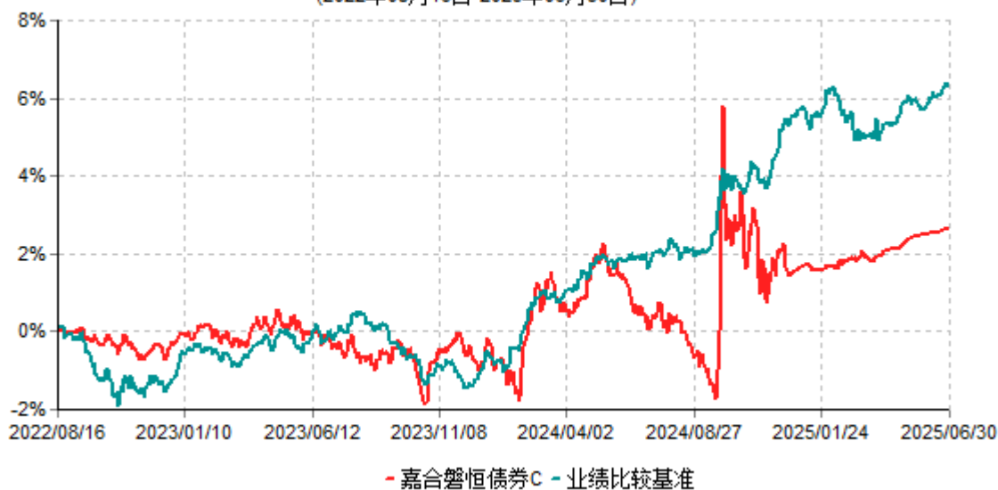
嘉合磐恒债券C累计净值增长率与业绩比较基准收益率历史走势对比图 (2022年08月16日-2025年06月30日)