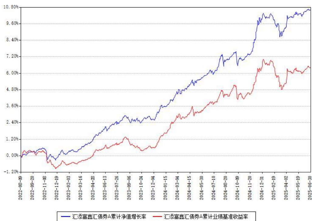
汇添富鑫汇债券C累计净值增长率与同期业绩基准收益率对比图