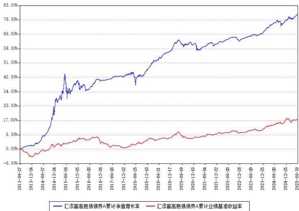
汇添富高息债债券A累计净值增长率与同期业绩基准收益率对比图