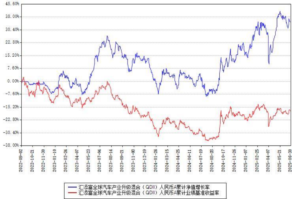
汇添富全球汽车产业升级混合（QDII）人民币A累计净值增长率与同期业绩基准收益率对比图