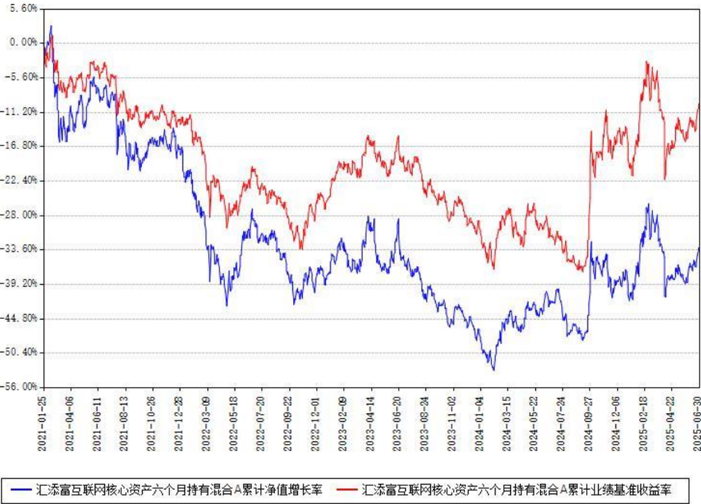
汇添富互联网核心资产六个月持有混合A累计净值增长率与同期业绩基准收益率对比图