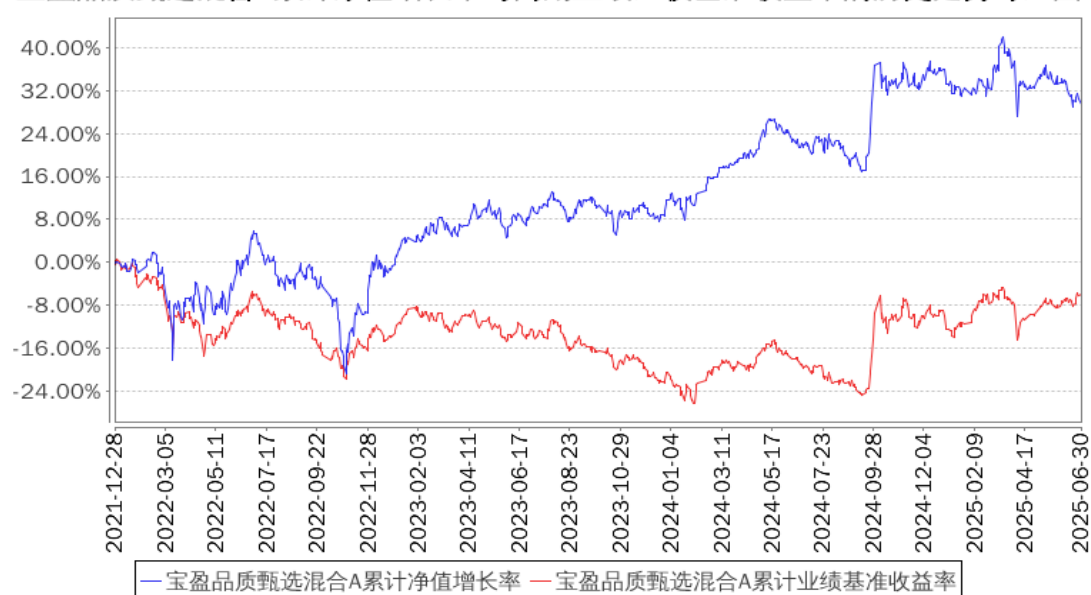
宝盈品质甄选混合A累计净值增长率与同期业绩比较基准收益率的历史走势对比图